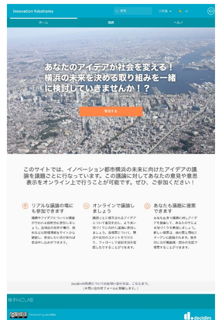
(図: Decidim WEB サイト)