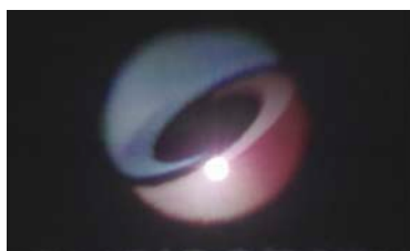
Gas Gushed Display: 映像の投影媒体として、ガススプレーを利用するシステム