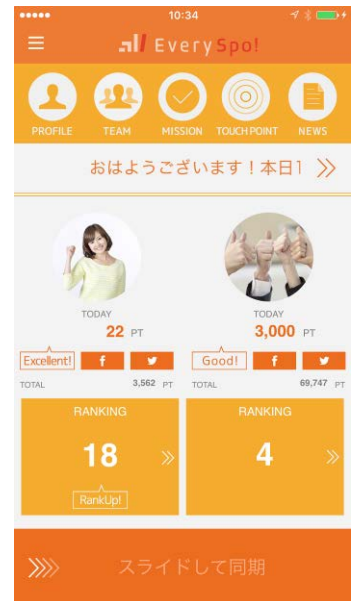
エブリスポ！の アプリ画面イメージ

本プログラムの提供対象は、すべてコーポレートゲームズにエントリーしている企業チームです。イベント開催までの1カ月間、チーム対抗で運動を継続することで、個々のメンバーの体力アップはもちろん、チーム内の士気やコミュニケーションの向上が期待されます。リアルなイベントとの運動により目的意識を明確にすることで、日々の運動継続と競技に向けたコンディションアップの相乗効果を図ります。