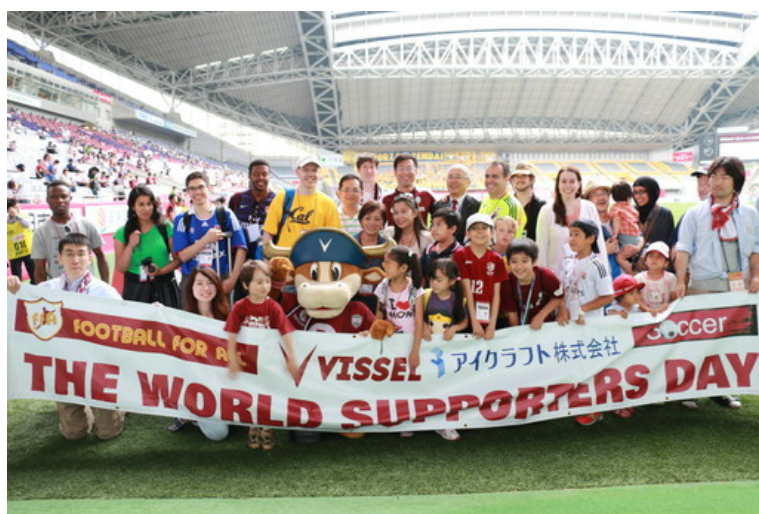
イベントには約 200 人の外国人招待客が参加

ISiD は、2014 年 12 月に 2020 テクノロジー & ビジネス開発室を設置し、「街づくり」「映像」「観光」などの分野を中心に新たなソリューション開発を加速させています。これらの取り組みを通じて、2020 年とその先に向けた日本の持続的な成長を、IT の力で支援してまいります。