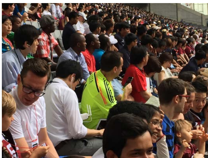
英語による実況解説を配信中の観戦エリア

potaVee の特長は、スタジアムのように多くの人が密集するエリアに、音声や映像を一斉配信できる点にあります。ISiD 独自のマルチキャスト配信技術により、Wi-Fi 通信の課題である輻輳(ふくそう) *2 を起すことなく、簡易なシステム構成で安定した配信環境を構築することができます。今回は、約 200 名の招待客観戦エリアへの配信を、ノートPCとアクセスポイント各1台という構成で実現しました。アクセスポイントの数を変えることで、スタジアム全体や特定エリア内など、配信範囲を柔軟に調整することができ、また複数言語での解説を同時配信することも可能です。