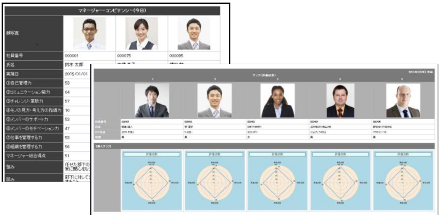
図 2: POSITIVE 画面イメージ

昨今、タレントマネジメントシステムを導入する企業は増加しつつありますが、人事・給与等の基幹人事システムが別システムの場合、システム連携するためのインターフェース開発や情報の二重入力が必要となることがあります。POSITIVE はタレントマネジメント機能と、人事・給与・就業管理機能等がシームレスに連携でき、効率的かつ迅速な人材マネジメントが可能となります。