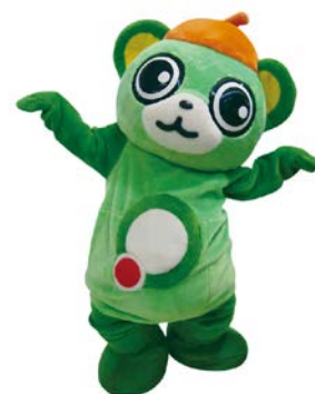
大崎駅西口商店会の名物ご当地キャラ 「大崎一番太郎」も表彰イベントに登場

■「エブリスポ！」実施概要■ ※公式サイト( www.everyspo.com )もご覧ください。