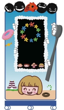
デンタルプロ向けにパッケージしたスマイルミラー(イメージ)

ISiD イノラボが開発した「スマイルミラー」は、参加者が前に立って笑うと、笑顔の度合いや性別などを判別し、「笑顔を貯める」ことができるサイネージシステムです。貯まった笑顔の情報や画像は、参加者の承諾を得てクラウド上で蓄積・管理され、複数の「スマイルミラー」画面やウェブサイトなどに表示させることも可能です。Coba-U は、本プロジェクトとのコラボレーションアルバム「スマイルレゲエ」のプロモーションやライブ活動を通じて、「スマイルミラー」にたくさんの笑顔を集めます。協賛企業は、貯まった笑顔の量に応じて、自社の社会貢献プログラムと連動した寄付活動などを行います。「スマイルミラー」の外観パッケージは、協賛企業の活動内容やコンセプトに合わせて制作することも可能です。単なる寄付や募金とは異なり、参加者に自社や支援先の活動を認知してもらい、共感を得ながら、笑顔が笑顔を呼ぶ、これまでにないチャリティプログラムを展開することができます。