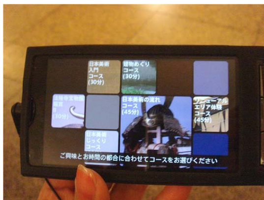
『とーはくナビ』イメージ

*ご参考: www.youtube.com/koozyt#p/a/u/2/cw_S8H9fRpA