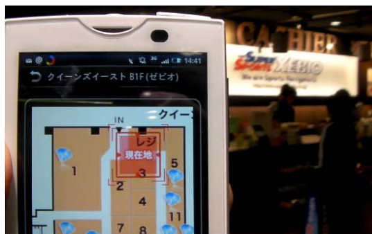
『スマートショッピング』体験イベントイメージ

*ご参考: www.koozyt.com/press/2011/pr110128.html