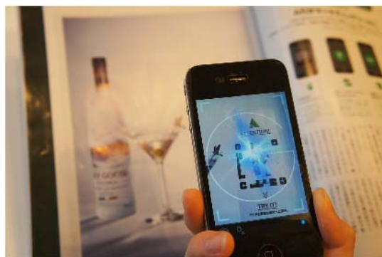
『GnG(GET and GO)』イメージ

*ご参考: 「GnG」サービス www.youtube.com/user/koozyt#p/u/9/4sGEaTjLcKw