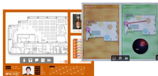
行動解析 及びレコメンドの様子