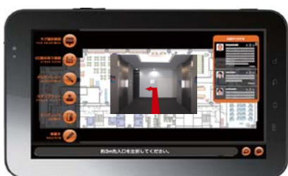
街のガイドの様子

ISiD 品川本社最上階を実際の「まち」に見立て、位置情報と連動した案内を行うガイドアプリケーションです。ガイド終了後は、スタジオで各エリアの滞留時間など各自の取った行動を解析したり他のユーザーと比較したりすることができます。「β」には、常に新しい技術を組み込んでいく“永遠のベータ版”の意が込められています。本アプリには、ISiD の資本・業務提携先であるクウジツ株式会社の位置測位技術「PlaceEngine」および AR 技術が実装されています。