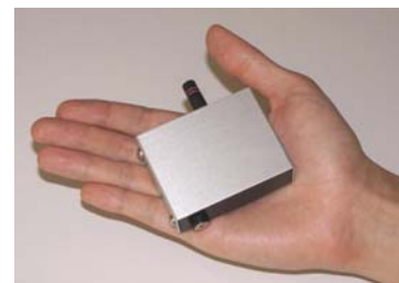
高精度屋内測位インフラ「Place Sticker®」

「Place Sticker®」は、スマートフォンなどの携帯端末を保有するユーザーに対して位置情報サービスを提供する技術です。高精度な測位を実現し、蛍光灯や LED で発電する屋内用の太陽電池でも稼働します。他の測位技術で不得意とされている 1メートル以内の測位および、電源のない場所での駆動について解決する技術として、ISiD は立命館大学、ローム株式会社と共に実用化を目指しています。詳細は、 http://www.isid.co.jp/news/2011/1004.html をご参照ください。